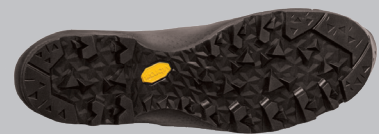
Laufsohle: Vibram Integral Light Profil